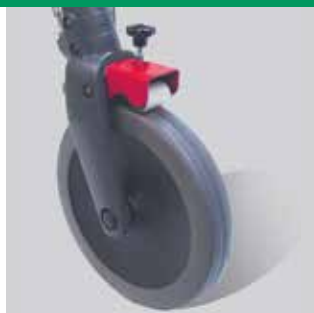
Freno di rallentamento (optional) Codice 13041-21 (paio)